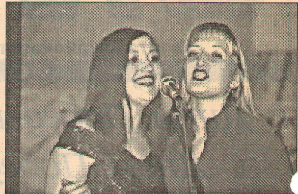
Вокальная студия «Экспромт», АГАУ.

И вновь, вот уже в седьмой раз, объединило студентов сибирского региона творчество, веселье, молодость на «Фесте-2004»!