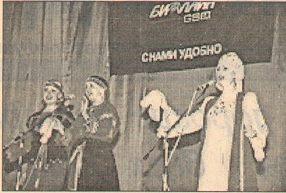
Лауреат фестиваля – ансамбль народной песни «Сказ», БГПУ.