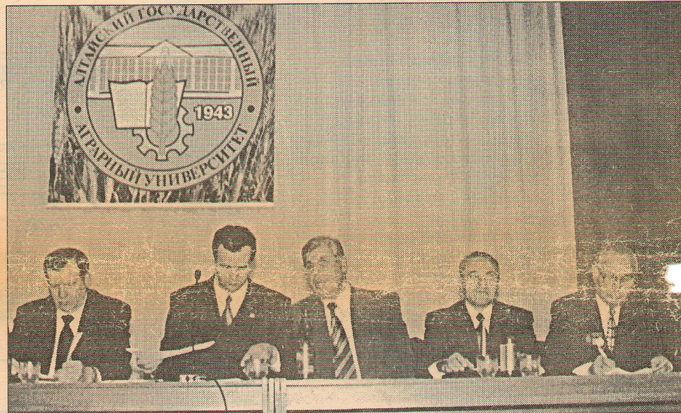
В праздничном президиуме.

Министерств, управления сельского хозяйства, комитетов администрации края и города, Законодательного собрания, воспоминания ветеранов АСХИ-АГАУ, его деканов, прежних и настоящих, – во все это плавно и ненавязчиво вплелись выступления участников юбилейного концерта. Среди них – великорусский государственный оркестр «Сибирь», Лауреат международных фестивалей, заслуженный коллектив Алтая, народный вокально-хореографический ансамбль «Юность», группа «Славяне»; из АГАУ – вокальная студия «Экспромт», студия современного танца «Черный квадрат»,