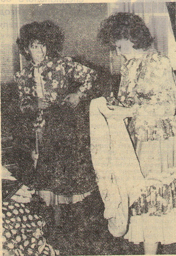
За несколько минут до начала концерта. Идут последние приготовления перед выходом на сцену.

Везде, где бы ни выступала агитбригада «Даур — 87», царил улыбки, веселье и хорошее настроение. За высокое качество концертных программ и лекций агитбригада награждена благо-