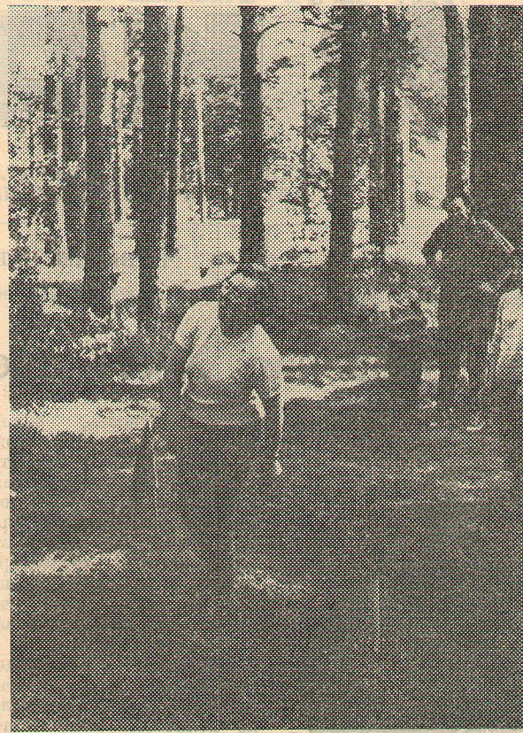
ДРУЖИМ СО СПОРТОМ. Профгруппа АХЧ на сдаче норм ГТО.