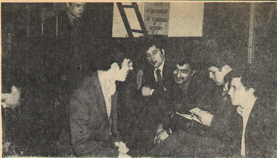
ПОСЛЕ ЭКЗАМЕНА

Сейчас учебный год в партийной сети закончен, но руководителям семинаров пора всерьез думать о будущем. Основой основ в их подготовке должны стать решения июньского Пленума ЦК, касающиеся повышения уровня идеологической и массово-политической работы. Это потребует от руководителей перестройки, заставит изменить методологию, готовить выступления в несколько ином плане. Все хозяйственные и экономические вопросы на занятиях должны быть тесно и неразрывно связаны с идеологией — вот что сказано в материалах Пленума, вот чего требуют от нас партия и правительство.