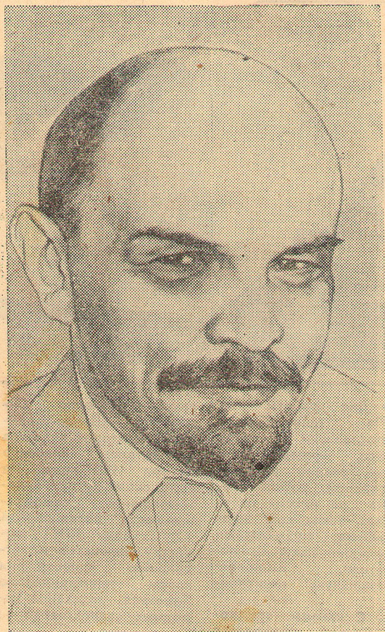
111-я ГОДОВЩИНА СО ДНЯ РОЖДЕНИЯ В. И. ЛЕНИНА