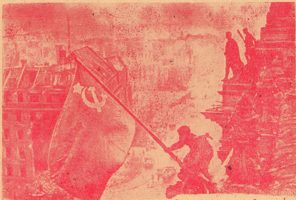
Знамя Победы над рейхстагом!

ПАРТКОМ, РЕКТОРАТ, ПРОФКОМ, КОМИТЕТ ВЛКСМ.