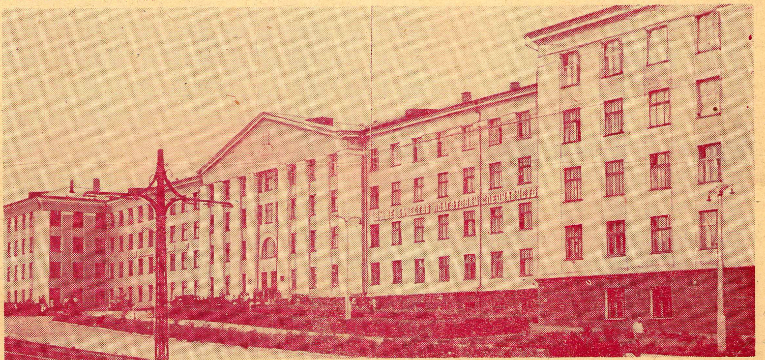
Главный учебный корпус института. 1 сентября юбилейного года его аудитории займут 650 первокурсников.